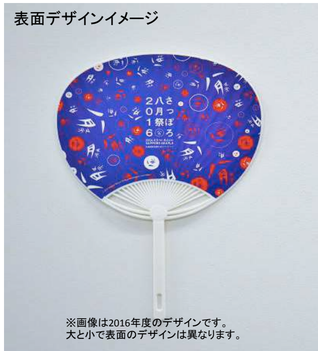
表面デザインイメージ