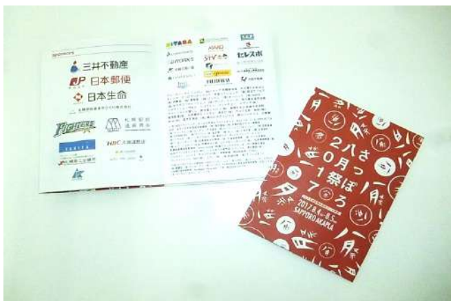
B4 4つ折り 10,000部